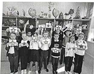
Классный час «Я помню, я горжусь!»