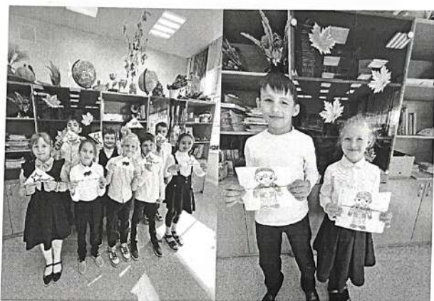
Акция «Письмо солдату»

Проект «Спасибо за победу!» оказался эффективным инструментом для привлечения внимания к историческим событиям, воспитания патриотизма и уважения к подвигам предков. Дальнейшая работа по сохранению памяти о Великой Отечественной войне и поддержанию связи с ветеранами является важной задачей для общества.