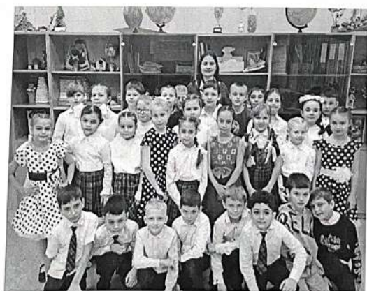
Литературная гостиная «Читаем о войне»